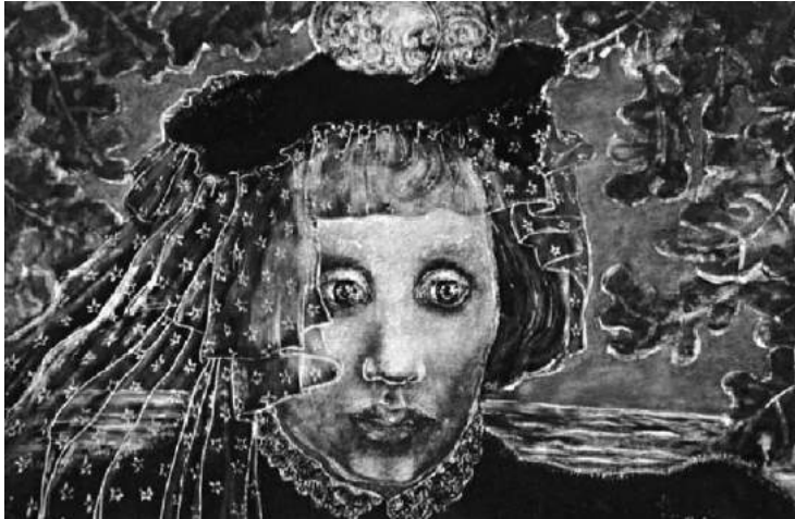
Fig. 2. Julia Thecla, Self-Portrait , 1936. Opaque watercolor and charcoal on cardboard, 10 3/4 x 8 1/2 in. Illinois State Museum, Springfield, Illinois.

con un mundo artístico que no recibía bien a las mujeres (fig. 2). En la obra se representa a sí misma con un pequeño sombrero tipo boina con una pluma blanca, de cuyo borde cae un velo cubierto con diminutas estrellas blancas, como las de la blusa de la fotografía de la exposición. También tiene puesto lo que