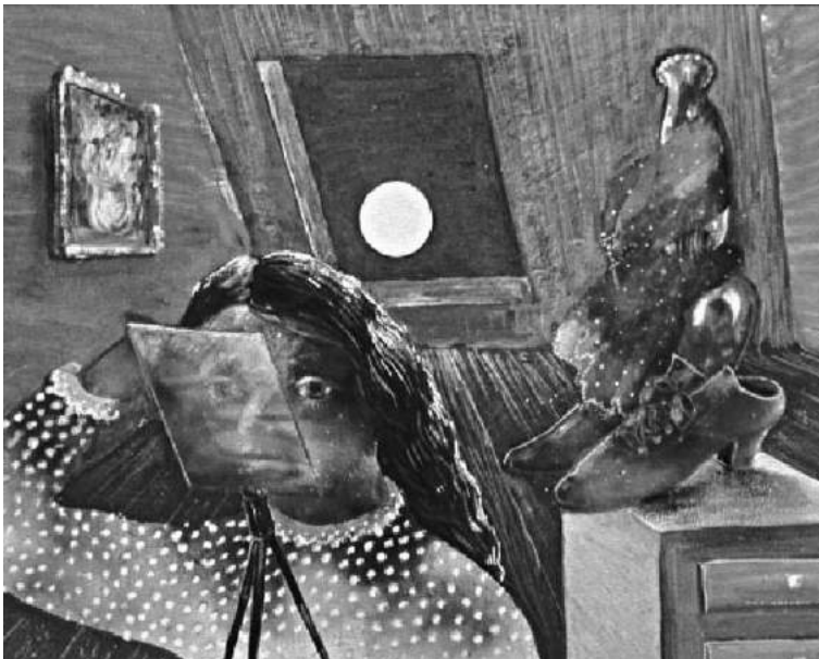
Fig. 7. Julia Thecla, Full Moon , 1945. Opaque watercolor, graphite, and charcoal on cardboard, 8 1/8 x 10 in. Collection of Mr. and Mrs. David Porter, Wainscott, New York.

Thecla toma el papel de la niña de largos cabellos ondulados usando una blusa de puntos con collar y puños de encaje y una falda larga. A la izquierda en Girl and Dog ella mira hacia el observador, pero como le es típico no reconoce nuestra mirada. Sostiene un extraño aro decorado con cuentas naranjas. 48 A la derecha en Talismán , ella parece estar parada al borde de una vasta extensión de agua azul, mirando hacia fuera en dirección a nuestra derecha. La joven mujer sostiene en su mano un pequeño colgante o símbolo ritual que está unido a una cuerda de cuentas que ella tensa como si jugara un juego con sus manos para hacer figuras con un cordel. En Full Moon (Luna llena) , también de 1945, Thecla mira a través de una pieza de vidrio colocada en un caballete miniatura jugando así con la larga tradición de autorretratos de artistas que se pintan a sí mismos mientras miran su reflejo en un espejo (fig. 7). Marsha Meskimmon señala que el espejo en el autorretrato “coloca cierto material en el centro del discurso y marginaliza otros”, una estrategia que seguramente