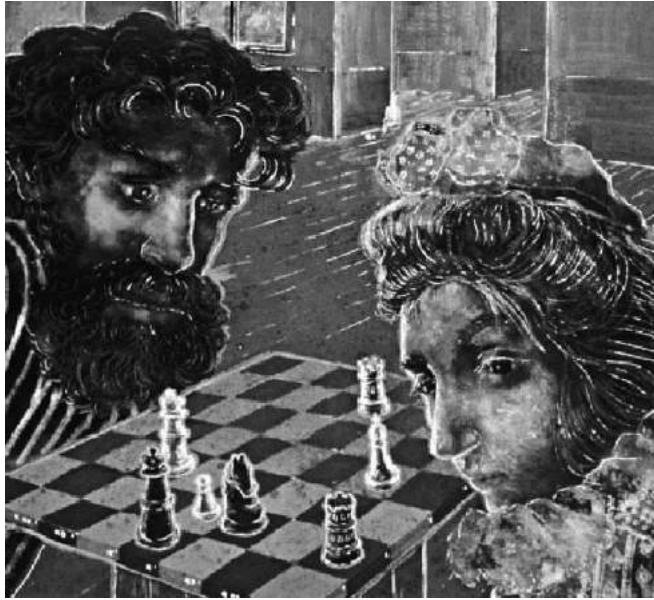
Fig. 3. Julia Thecla, Chess: White's Move , c. 1939. Opaque watercolor and charcoal on cardboard with gesso ground, 5/ 34 x 11 3/4 ins. Illinois State Museum, Springfield, Illinois.

de Thecla está tan absorto pensando su siguiente movimiento, que no se da cuenta de que la artista creó un tablero de ajedrez no autorizado: ocho cuadros por siete, en lugar de ocho por ocho. Su excesiva feminidad disfraza su intenso deseo de ganar una partida, y como sostenía Riviere, “[...] ella se siente como si estuviera ‘interpretando un papel’, se interpreta como una mujer poco educada, tonta y perpleja; que, sin embargo, logra hacer una declaración”. 34 La mirada aparentemente distante de Thecla nos alerta sobre el juego de su máscara femenina, encubriendo su vasto conocimiento del juego, que jugaba muy a menudo por correo, protegiéndose así de cualquier represalia proveniente de sus oponentes masculinos, así como también ocultando la agresividad implícita en su comportamiento. 35