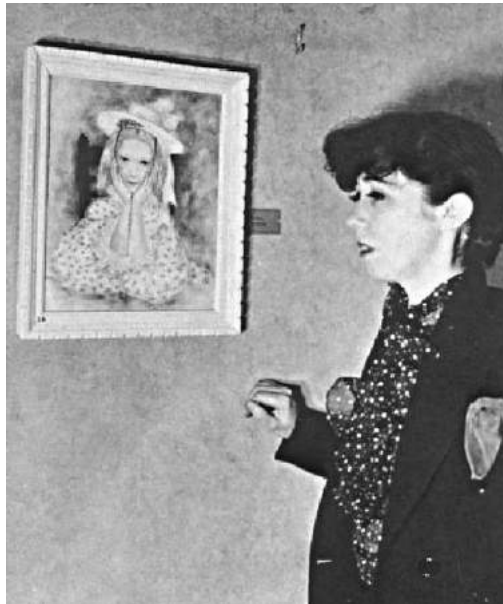
Fig. 1. Fotografía de Julia Thecla at the Art Institute of Chicago, 1936.

En un autorretrato, también de 1936, podemos ver todavía más claramente la feminidad excesiva que la artista solía adoptar, en aras de poder negociar