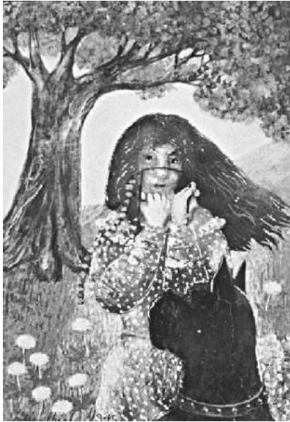
Fig. 5. Julia Thecla, Girl and Dog , 1945. Opaque watercolor, graphite and charcoal on cardboard, 6 7/16 x 4 3/8 ins. Collection of Harold M. Finley, Lockport, Illinois.